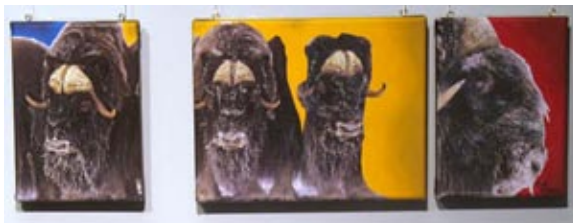
L'effet bœuf, Myriam de Lorimier

Dès les premiers pas dans le monde de Composite Mot-Image souffle sur nous un vent environmentaliste! L'effet bœuf de Myriam de Lorimier souligne la menace d'extinction de certaines races d'animaux, — tel le